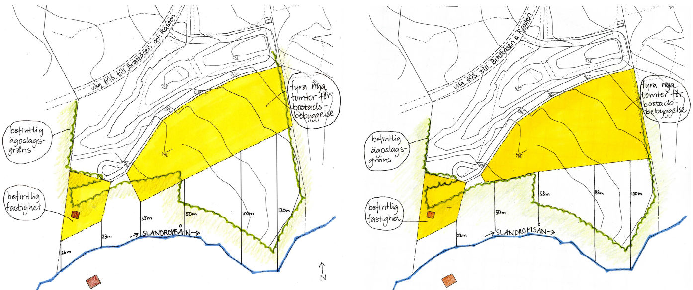
Illustrationer: Avstånd från Slandromsån till befintlig respektive föreslagen bostadsbebyggelse. Bilderna visar hur planförslaget har förändrats från samråd till utställning.

Till utställningsskedet har planförslaget omarbetats för att minska intrånget på strandskyddsområdet längs Slandromsån.