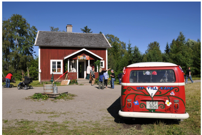
Fotografierna är tagna av Jamtli och visar hur byggnaderna/miljöerna kan komma att se ut