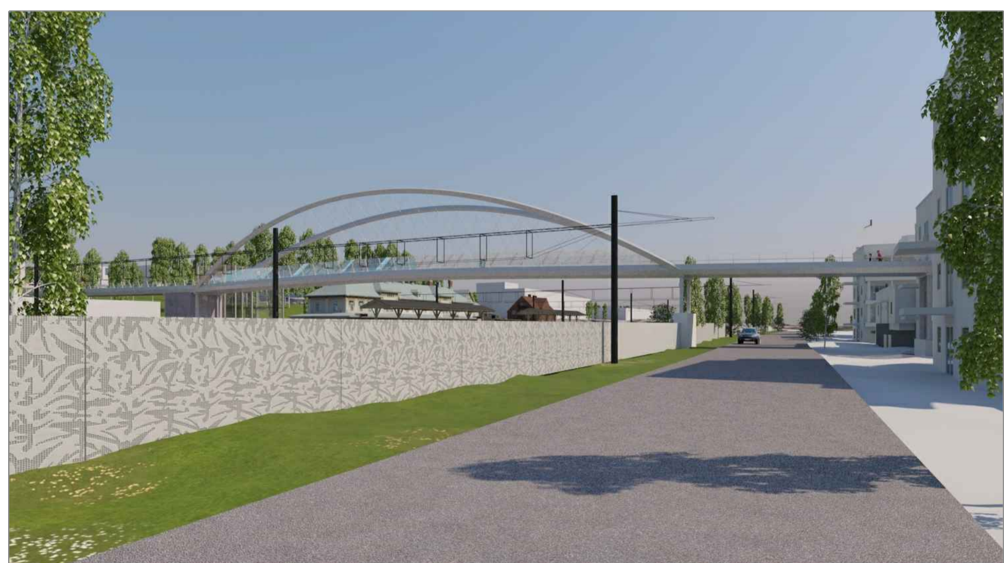
Ny gång och cykelbro som kopplar samman Österängsparken med Storsjö strand. Illustration: Ramböll