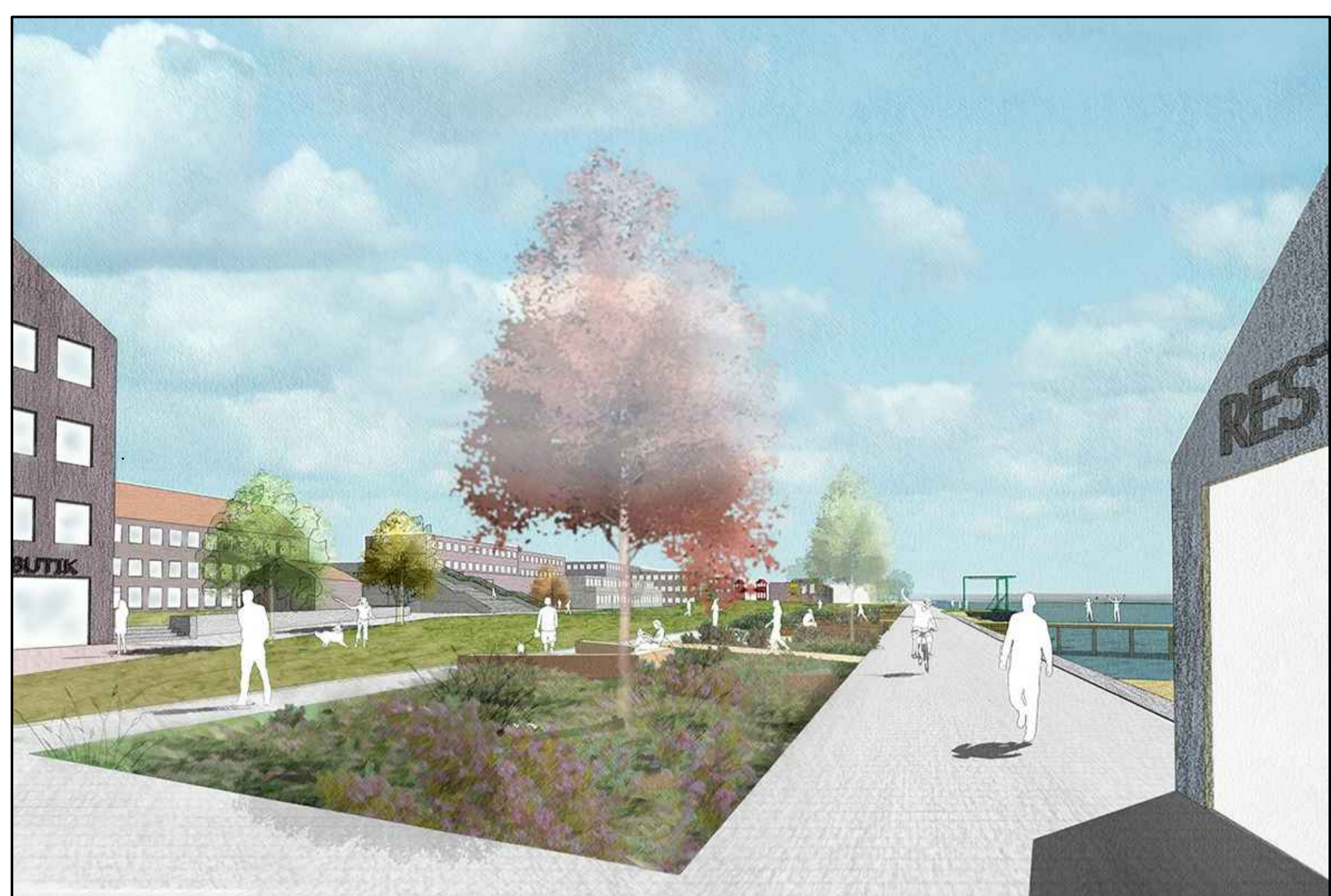
Exempel på hur den nya strandparken kan utformas. Byggnadsvolumerna är ogestaltade och visar endast föreslagen bebyggelsens volym, placering och skala. Illustration: Krook & Tjäder Arkitekter