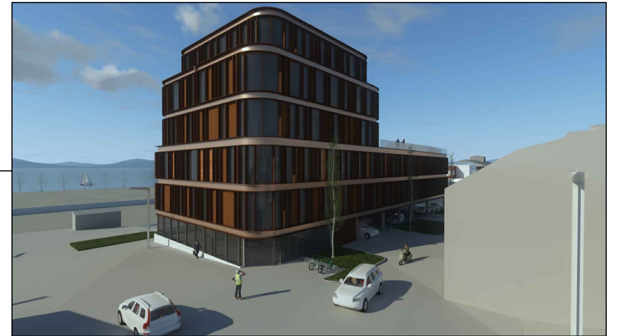
Vy mot den föreslagna bebyggelsen. Närmast i bild syns byggnadsdel med entréparti i markplan, bortre del avses utformas med öppet markplan för parkeringar och miljörum. Illustrationen visar endast ett exempel på hur den nya bebyggelsen kan utformas.