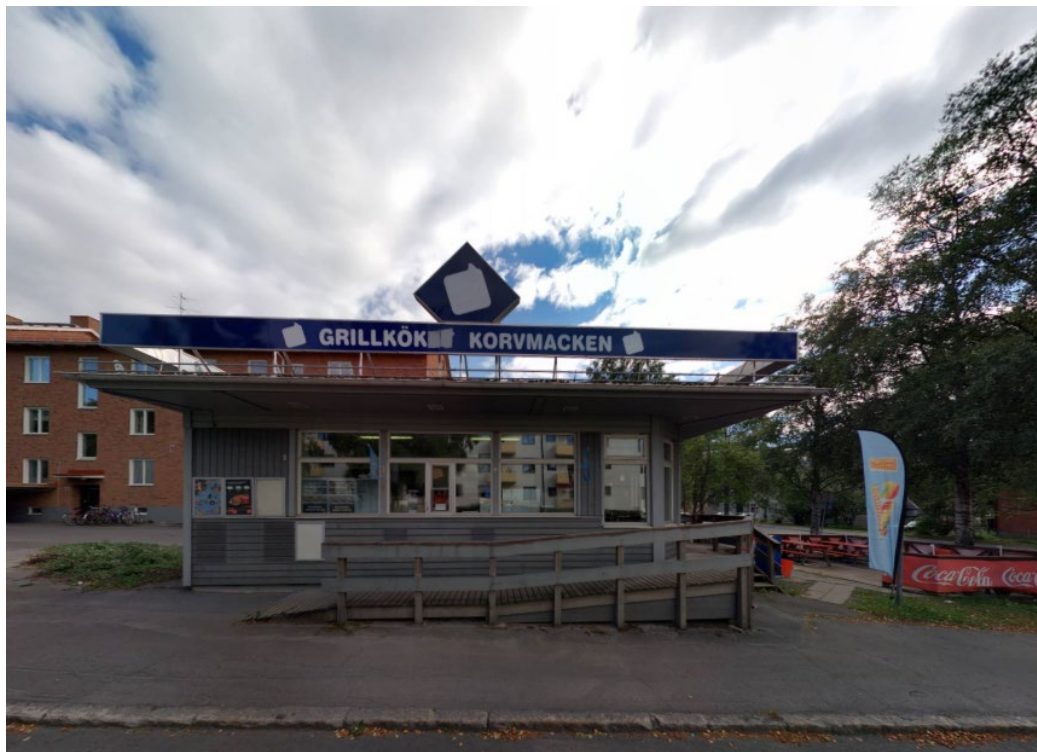
Gatuköket som det ska bildas en egen fastighet för.