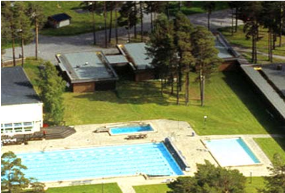
Utomhusbassänger och tegelbyggnaden som nyttjas av campingen.

I sydöstra hörnet, av fastigheten, ligger en envånings tegelbyggnad, saxad i sidled i sidled. Byggnaden nyttjas av Östersunds Camping och innehåller 8 st vandrarhemsrum, samvarorum, separata dusch/hygienutrymmen och förråd.