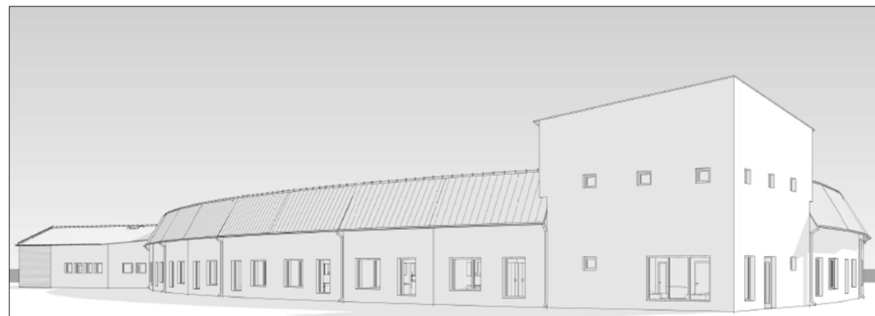
Illustration - äldreboende

Illustrationskartan redovisar endast ett exempel på hur markområdet kan utformas med byggnader och parkering.