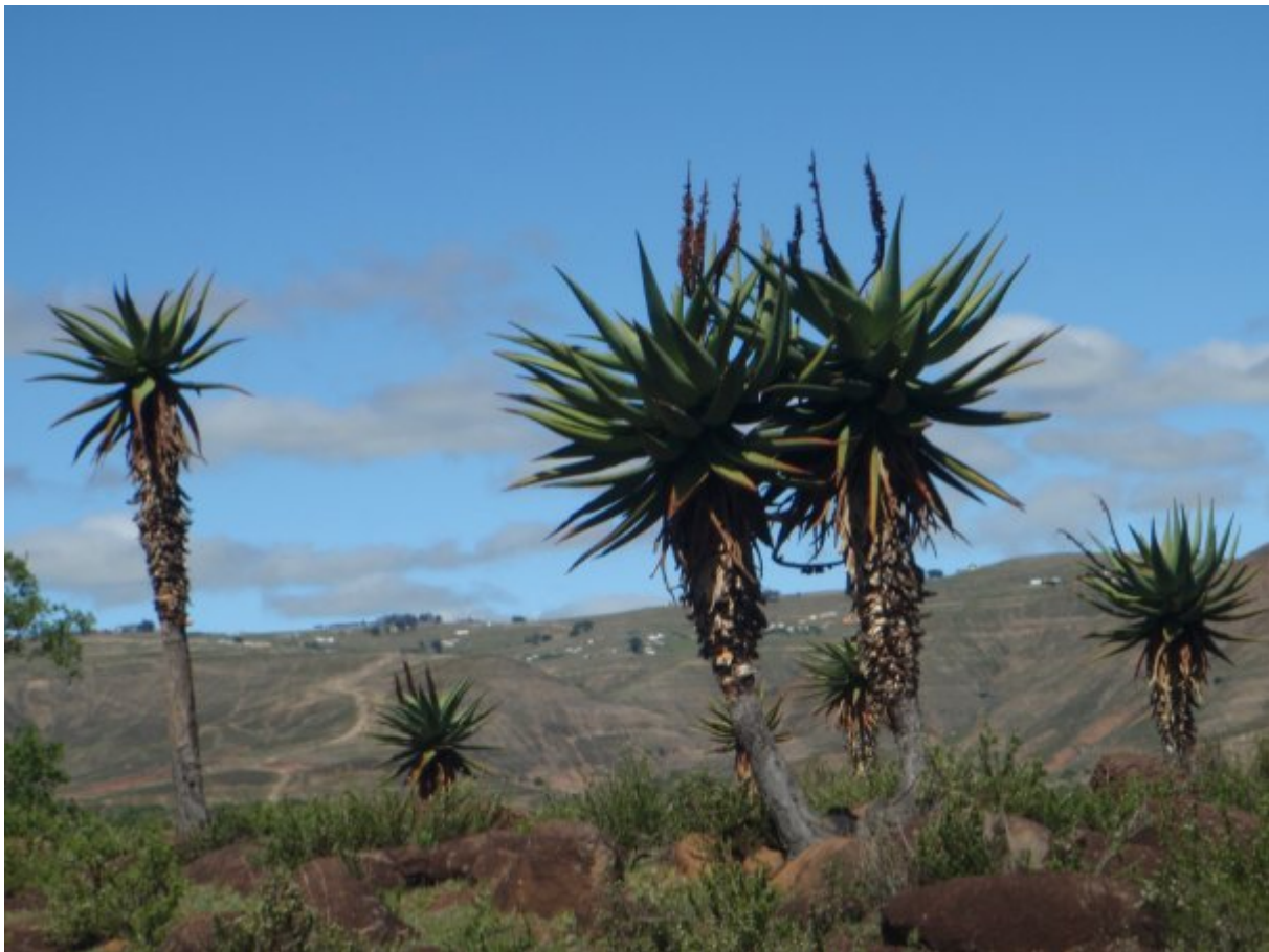
Så här kunde landskapet se ut.