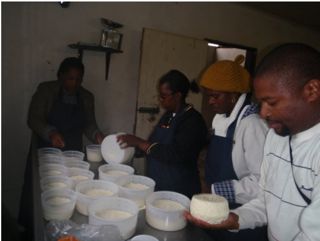
Ystningskurs- vändning av ost

Vi har också fått se skillnaden mellan farmlands och rural land, där farmlands mestadels består av vita farmare. Farmlands är betydligt mycket mer utvecklat i form av bevättning osv och består av en bättre jordmån, medan rural land ofta är de sämre, steniga markerna runt bergens sluttningar, dvs svårare att bruka rationellt.