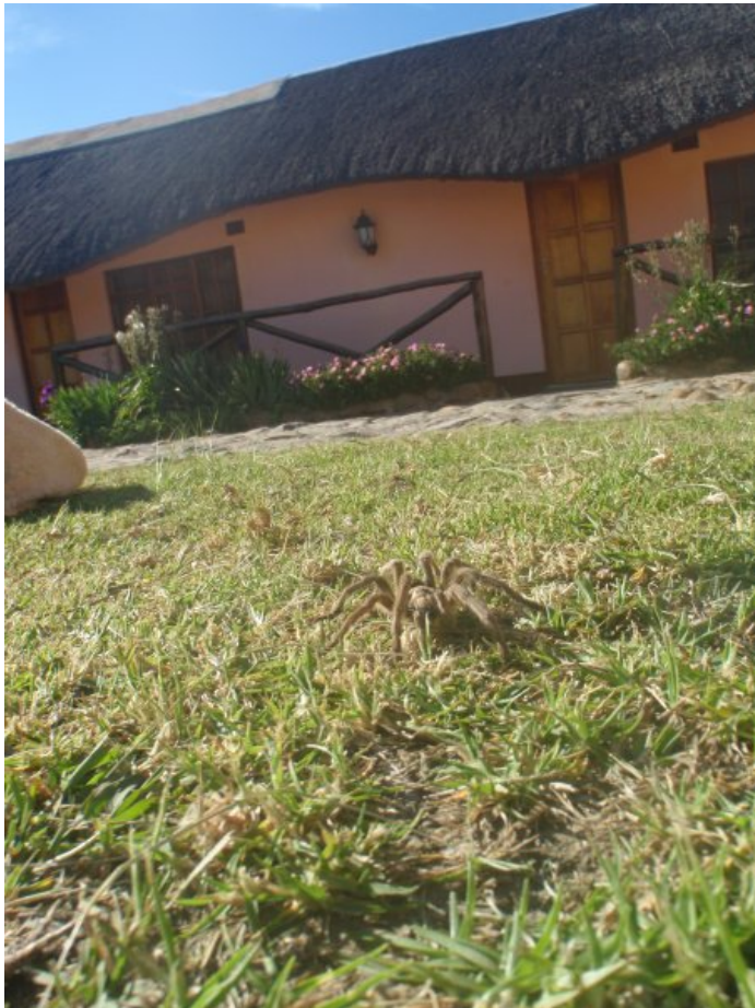
Imvelo Guesthouse, där även denna tarantulaspindel trivdes. ☺