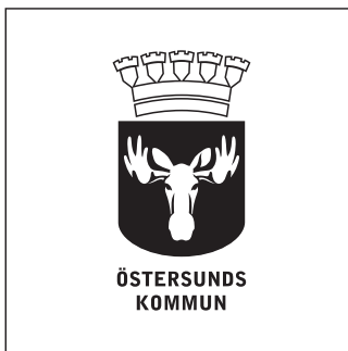
Version S (svart)