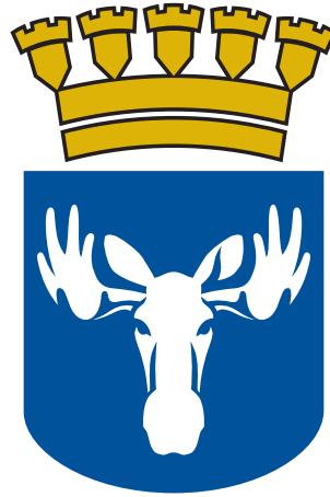
MUNICIPALITY OF ÖSTERSUND