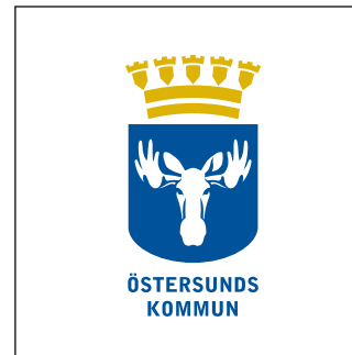
Version 2F (2-färg)