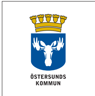
Version F (färg)