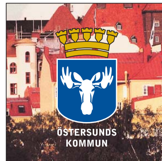
Version F (färg)