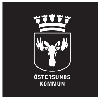
Version V (vit)