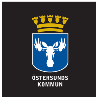
Version F (färg)