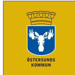
Version F (färg)