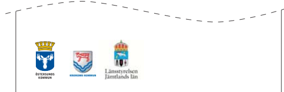
Exempel 2, sidfot