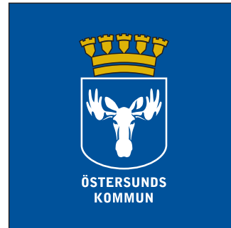
Version F (färg)