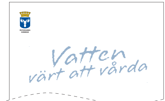
Exempel 3, broschyrframsida

Kommunvapnet får aldrig användas i direkt anslutning till andra logotyper eller grafiska element.