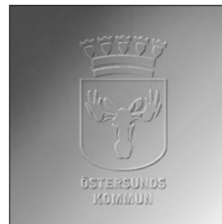
Version V (vit)

Kommunvapnet kan placeras på i stort sett vilken bakgrund som helst, men vitt och profilblå bakgrund rekommenderas i första hand. Tänk på att det finns fyra olika versioner av vapnet anpassade för olika bakgrundsfärger och tryckmetoder.