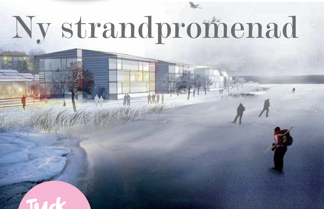
ILLUSTRATION: MONDO ARKITEKTER