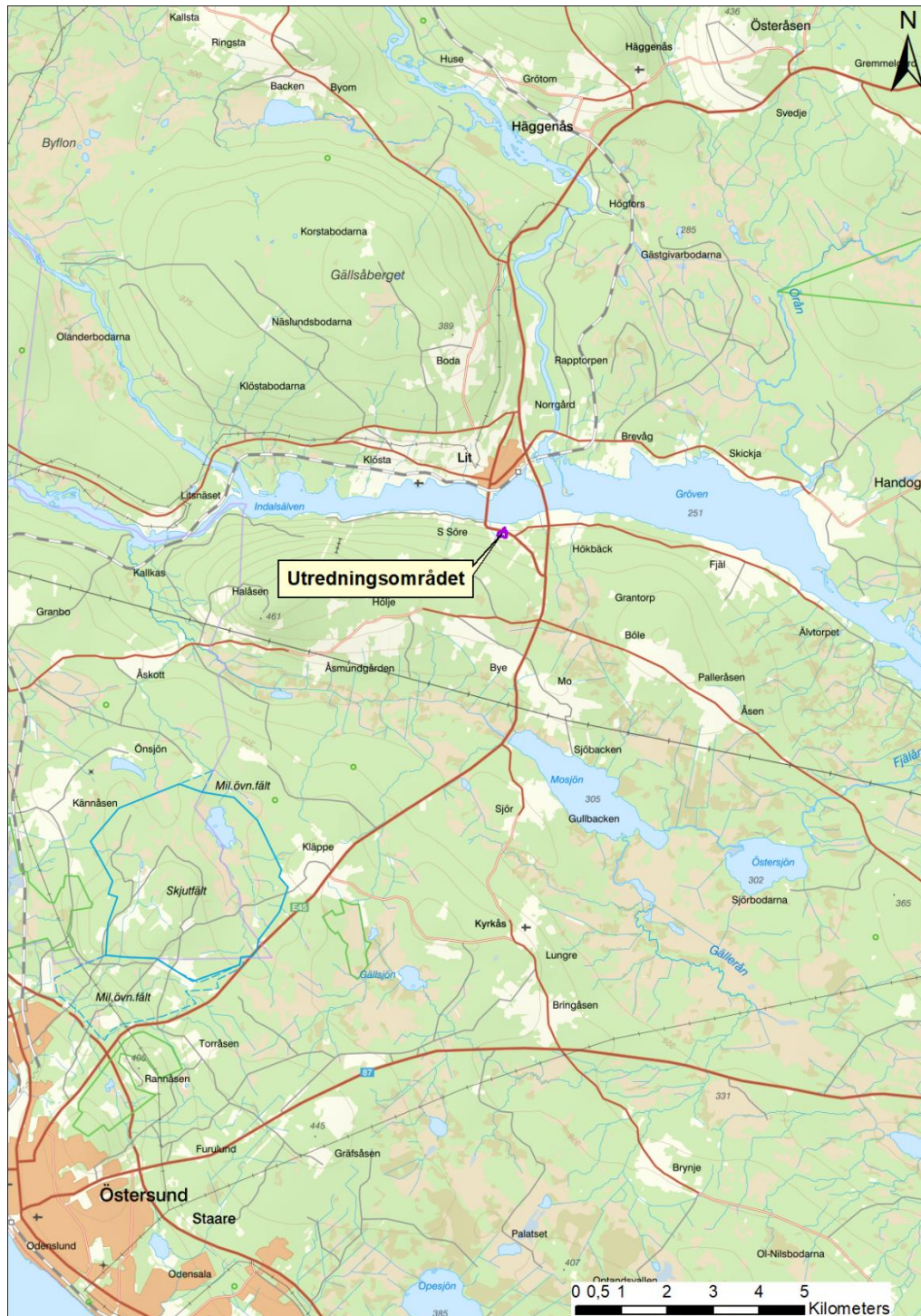
Figur. 1. Översiktskarta. Utredningsområdet är markerat med lila färg.

Med anledning av att Östersunds kommun planerar byggnationer inom fastigheten Söre 5:5, Lits socken i Östersunds kommun, har de inkommit med en förfrågan till Jamtli om att genomföra en arkeologisk utredning. På en del av fastigheten Söre 5:5 är gårdstomten L1947:6267 registrerad. Gårdstomten har namnet Klingeröga och är belägen i Södra Söre.