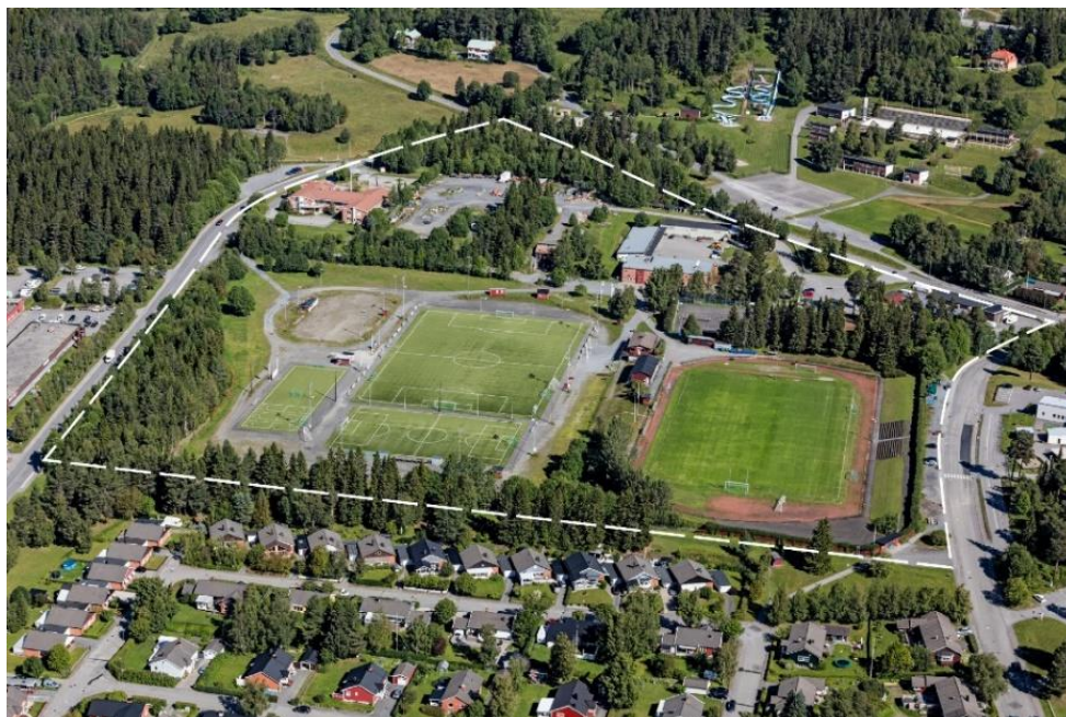
Karta över planområdet.

Programmet ska särskilt belysa förhållandet mellan idrottsplatsen och nya bostäder, lyfta fram möjligheter och aspekter som behöver beaktas under det fortsatta detaljplanearbetet. Utgångspunkten är att idrottsplatsens verksamhet inte ska påverkas negativt av förändringarna som föreslås, utan ges möjlighet att utvecklas.