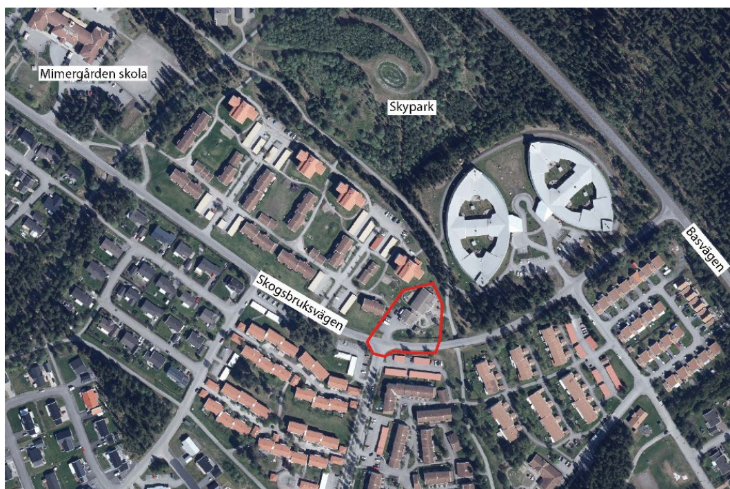
Karta över planområdet (markerat med röd linje).