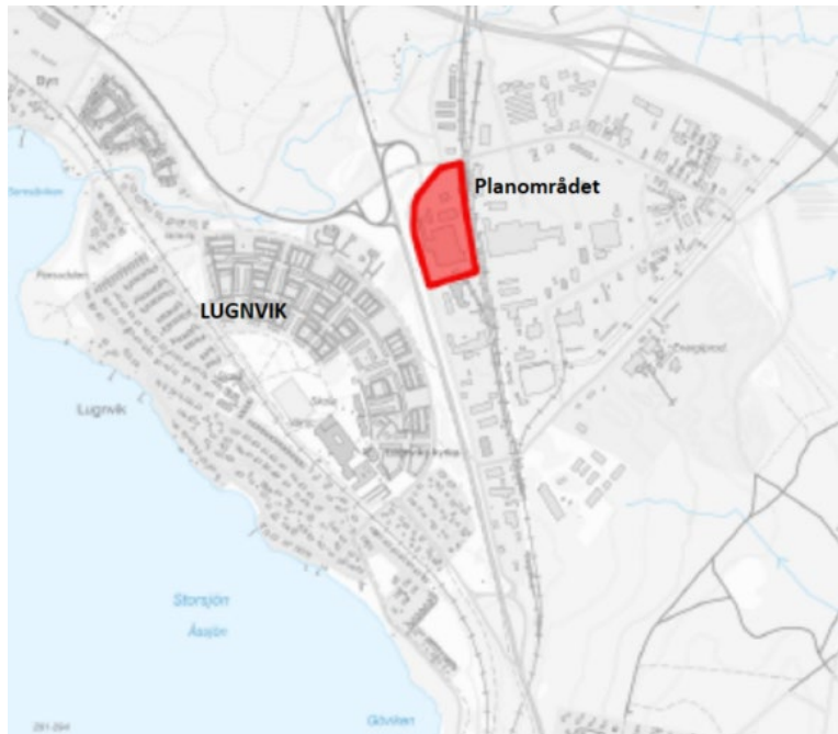
Karta över planområdet