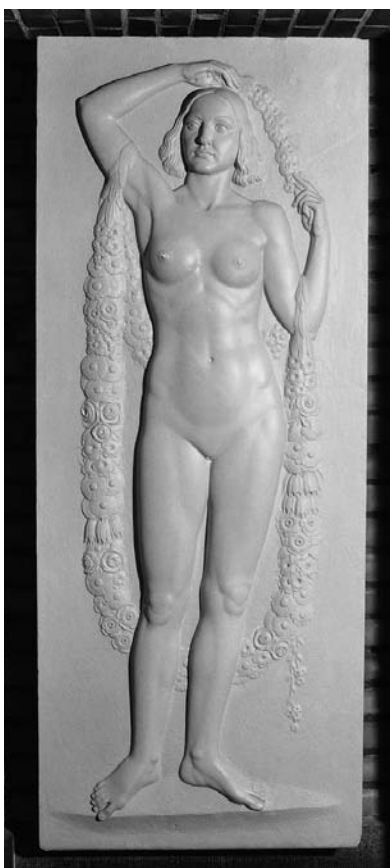
Olof Ahlbergs relief Sommaren.

Kommunens hemsida ska utvecklas löpande och aktuell information ska alltid finnas på hemsidan. Information om kulturföreningarnas verksamhet och kulturutbud i kommunen ska förbättras och utvecklas genom skapande av en "Kulturportal" och en "kulturkalender" i samverkan med andra.