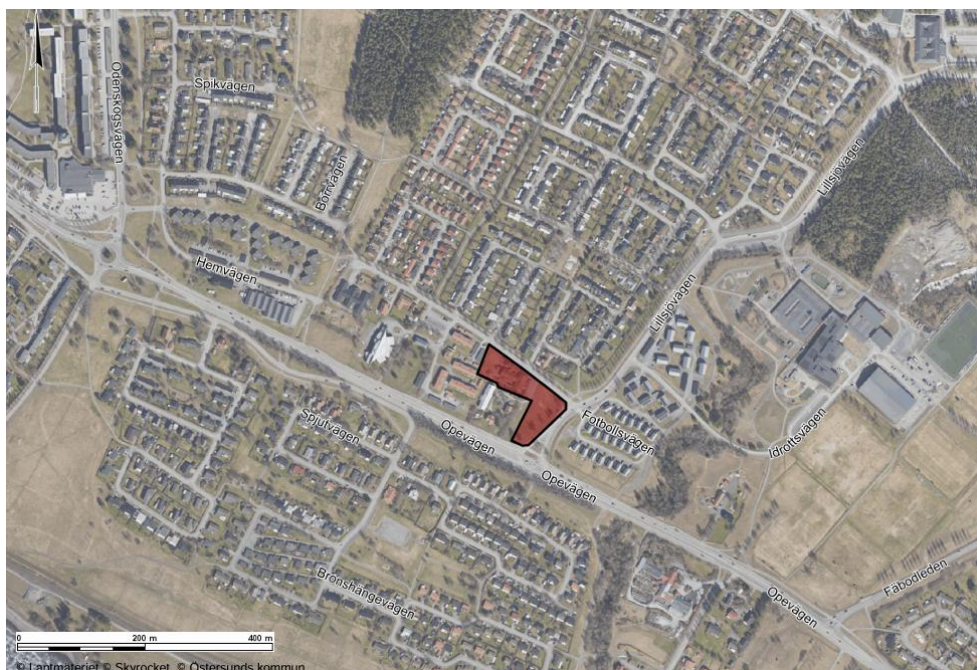
Karta över planområdet

Syftet med att ta fram en detaljplan är att möjliggöra en förtätning längs Opevägen genom att skapa möjlighet för bostäder i form av särskilt boende. Planen ska säkerställa att den nya bebyggelsen utformas med en omsorgsfull och varierad gestaltning som harmoniserar med och kompletterar områdets befintliga karaktär.