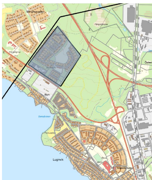
Karta över Brittsbo, där gatorna utgör planområdet

Syftet med att ta fram en detaljplan är att ändra huvudmannaskap för gatorna i Brittsbo. Enligt nu gällande plan ansvarar en gemensamhetsanläggning för gatorna. Planen syftar till att ändra detta till kommunalt huvudmannaskap, vilket medför att ansvar för skötsel och drift av gatorna kommer att ligga på kommunen och inte delägare i gemensamhetsanläggningar.