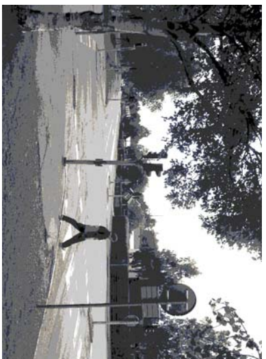
Kronikesvägen – Fagerbacken

DETTALPLANEN Antagen av NSN 15 december 2004 Laga kraft 12 maj 2005 Afskrifning 2389K-72005/23 Tillvägagångssätt och samrådshandlingar i detaljplanens beredning, den 17/12 2004 Agnete Johansson Miljö- och samhällsbyggnadssektorn AVTÄGANDEHANDLING Planhandlingen består av: - Planer till detaljplan - Paragrafer med bestämmelser - Bild- och geometriändringskrav - Illustrationskarta - Utlåtande