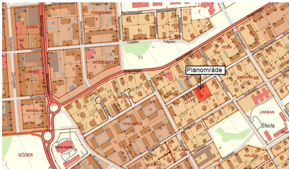
Karta över planområdet