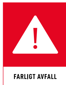
FARLIGT AV FALL