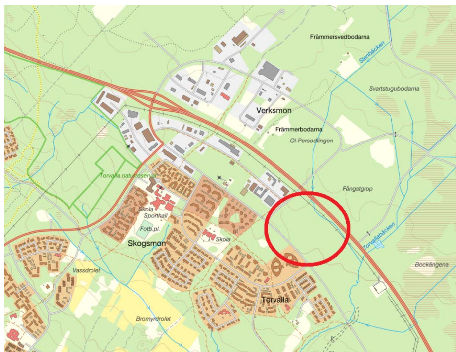
Karta över planområdet

Syftet med planarbetet Syftet med att ta fram en detaljplan är att möjliggöra industri och lättare verksamheter på del av fastigheterna Torvalla 4:18 ,7:44 och 6:85. Området blir en förlängning av verksamhetsområdet som sträcker sig från avfarten från E14 till Skotarvägen.