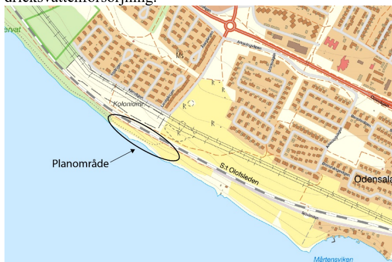
Karta över planområdet.

Huvudsyftet med att ta fram en detaljplan är att möjliggöra en pumpstation för råvattenintag till det nya vattenverket som planeras i Minnesgårde. Anläggningen är en samhällsviktig verksamhet som behövs för att säkerställa Östersunds dricksvattenförsörjning.