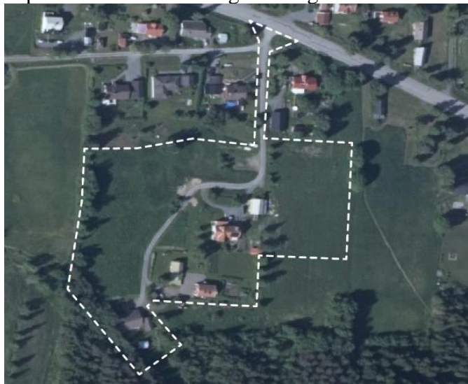
Karta över planområdet

Syftet med att ta fram en detaljplan är att få fram attraktiva villatomter till försäljning i Lit. Inom Söre 5:5 bedöms tre tomter kunna tillskapas som är anpassade till den naturliga terrängen i området.