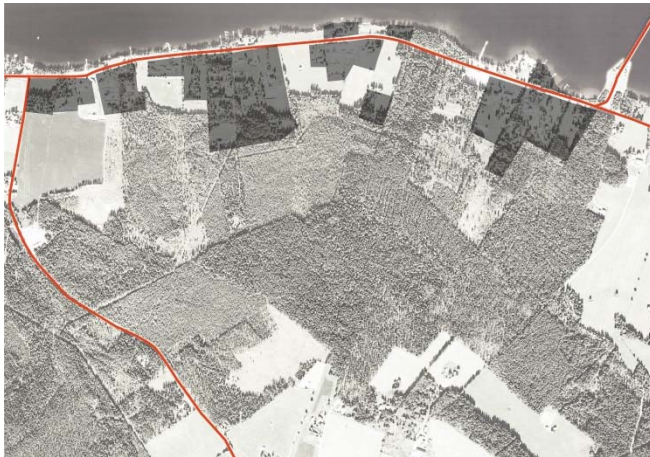
Kartan ovan visar nollalternativet. Befintliga bebyggda fastigheter inom planområdet är markerade med mörkgrått.

I nollalternativet utgår vi från att den gällande detaljplan nr 146, för området, ska fortsätta att gälla och att inga nya detaljplaner tillkommer. De flesta av de tomter som är utpekade för bebyggelse, i detaljplanen, är redan bebyggda. Nollalternativet innebär att vatten och avlopp fortsätter att utgöra en begränsande faktor för exploatering i området som ligger utanför kommunalt verksamhetsområde. Samtidigt gäller Östersund 2040 som säger att det ska göras en fördjupad översiktsplan för en stadsdel i området. Konsekvensen blir att inga nya detaljplaner kan göras eller bygglov beviljas utom det som följer gällande detaljplanen F146.