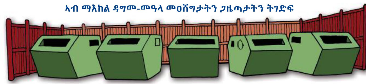
ኣብ ማእከል ዳግሙ-መዓላ መዕሸግታትን ጋዜጣታትን ትገደፍ

መዕሸግታት ከከም'ቲ ዝዓበዩ ክፋሎም ፈላልዮም። መጣጣጣ ዚብሉን ዚኸትቱን ነገራት ከይህልዉ ኣጽርዮም፤ ኣብ ማእከል ዳግሙ-መዓላ ከኣ ግደፎም። ኣብ ኣፓርታማ ትቕመጥ እንተ ኾይንካ፡ ኣብቲ መጉሓፊ ክፍሊ ናይ መዕሸግታት መኣከቢ ኪህሉ ይኸክልዎ። መዕሸግታትን ጋዜጣታትን ከም ዘለዉዎ (ኣብ ጉማ ከይዓሸግካ) ኣቕምጡም።