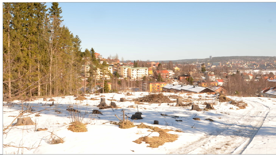
Bilden visar planområdet sett från väster med Skogsvägen i ryggen.

Koordinatsystem i plan och höjd: Sweref 99 14 15 resp RH 2000